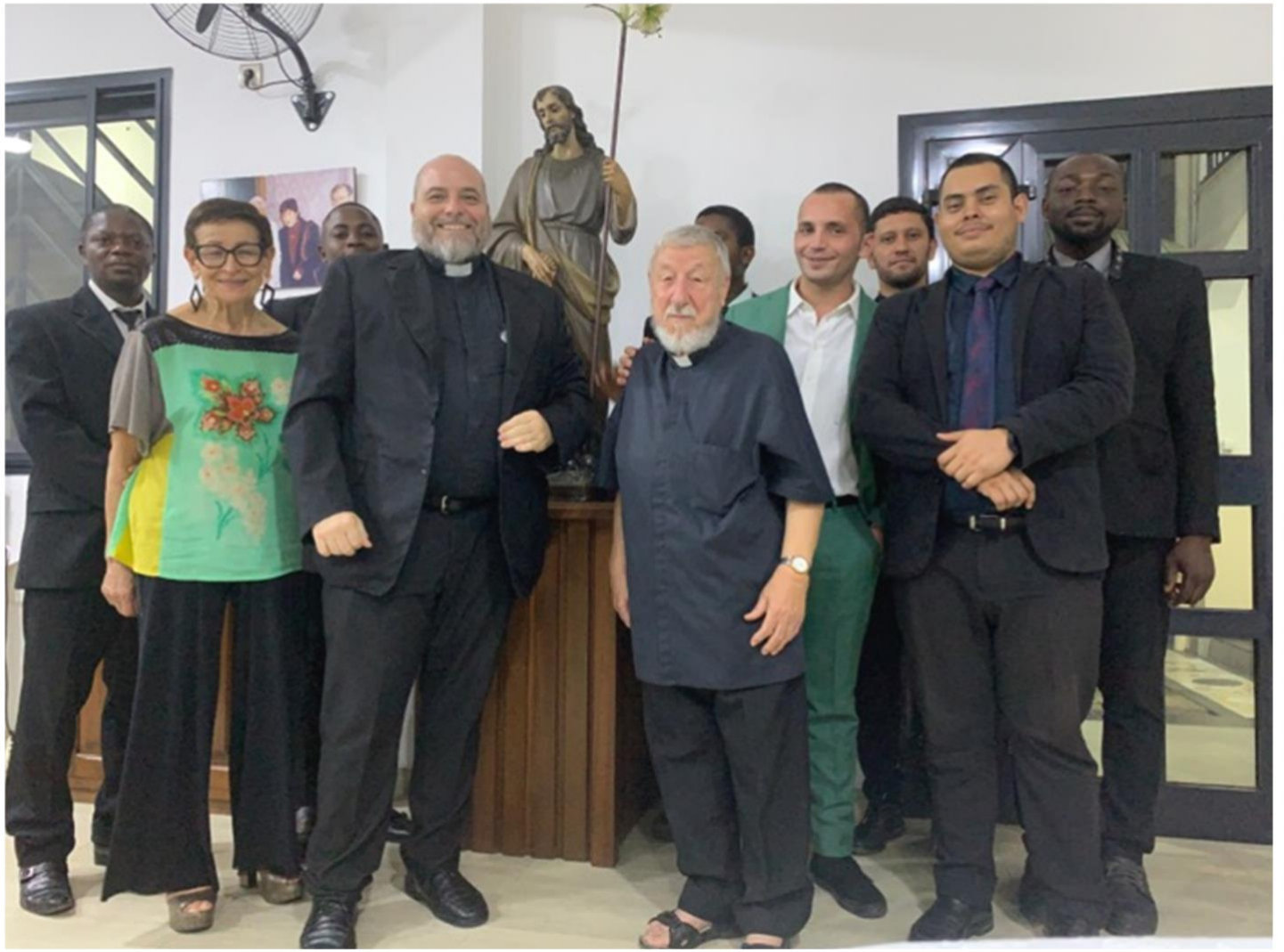
Figura 17 - Il seminario nel refettorio, presso la statua di S. Giuseppe, dopo la cena di festa che ha concluso la celebrazione.

Abbiamo concluso la solennità con una bella Eucarestia, esponendo alcune reliquie di santi che abbiamo in seminario, seguita da una cena festosa e poi da qualche canto popolare.