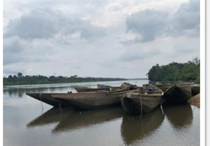
Figura 5 e 6 – A sinistra la strada fangosa (che poi peggiora) per arrivare al fiume. A destra il fiume Dibamba con alcune barche usate dai pescatori locali per la pesca e per l'estrazione della sabbia da cantiere edile.