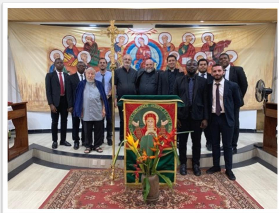
Figura 1 – I seminaristi, i formatori e i catechisti itineranti alla convivenza di inizio seminario, domenica 9 ottobre 2022

Abbiamo iniziato il nuovo anno pastorale e accademico 2022/23