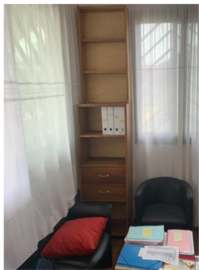
Figure 13 e 14 – Alcuni nuovi mobili per le nostre stanze.

Ora attendiamo ulteriori consegne, per terminare l'arredamento delle stanze nuove, e poi si vedrà se avremo modo di ordinare altri mobili per completare le stanze vecchie.