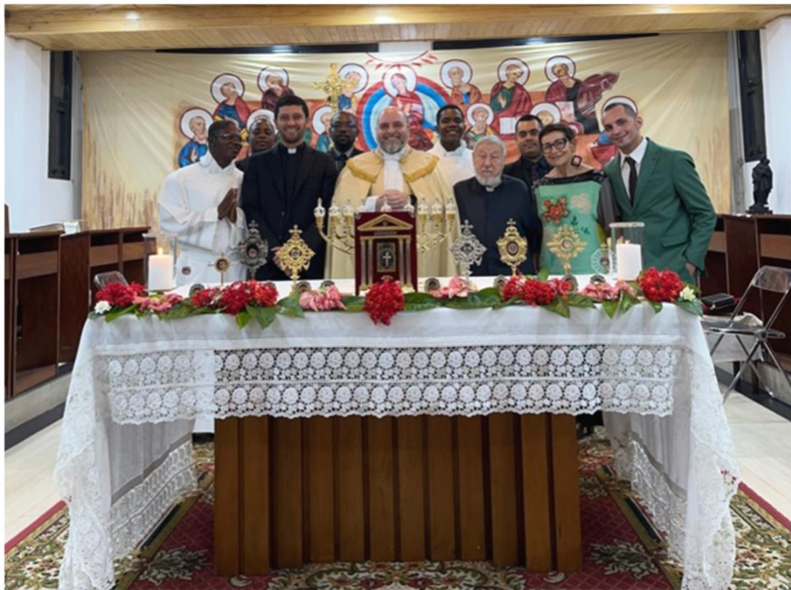
Nella pagina precedente figure 15 e 16 – Alcuni momenti dell'Eucarestia solenne per Ognissanti.

Siamo anche contenti di rendervi partecipi della grande festa che abbiamo vissuto per la solennità di Tutti i Santi, che in Camerun abbiamo celebrato domenica 30 ottobre. Abbiamo potuto estrarre a sorte un santo come patrono personale per ciascuno dei seminaristi, formatori e sorelle in missione, includendo anche i ragazzi che sono in missione all'estero.