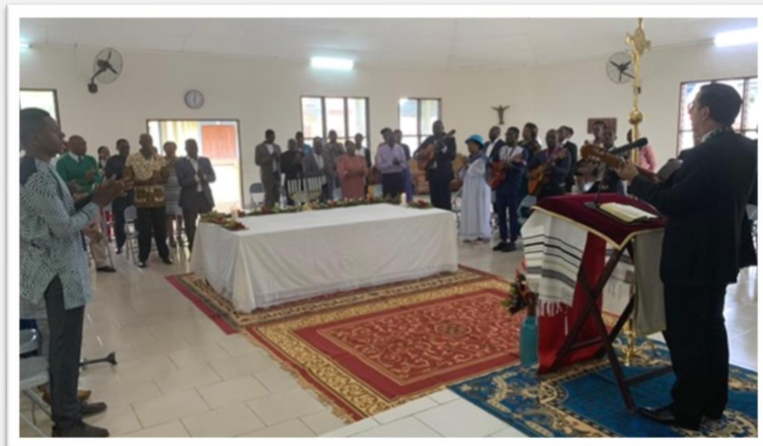
Figura 10 e 11 - In alto l'Eucarestia al centro Franciscano di Melong. Sotto un momento della catechesi.

Un'altra grazia che ci ha fatto il Signore è stata la partecipazione alla Convivenza di inizio corso del Cammino Neocatecumentale in Camerun, dal 20 al 23 ottobre, a Melong, un villaggio a 170 km da Douala. A parte la strada, veramente impegnativa quanto a tempo di percorrenza, a buche e voragini, l'esperienza è stata molto arricchente: abbiamo ricevuto una catechesi sull'amore e la sessualità nel piano divino e ci siamo confrontati con i fratelli e sorelle camerunesi presenti all'incontro (circa una sessantina).